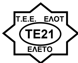
ΕΛΟΤ/ΤΕ21 «ΟΡΟΛΟΓΙΑ – ΓΛΩΣΣΙΚΟΙ ΠΟΡΟΙ»