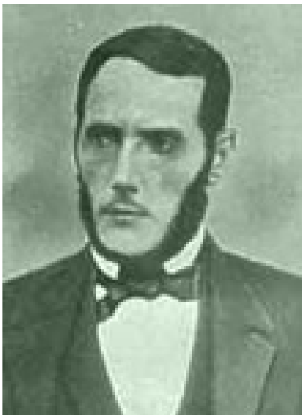
Antoine Hercule Romuald Florence (1804-1879)