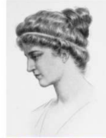
Αφιερωμένο στην Υπατία (370-415)

14 ο Συνέδριο «Ελληνική Γλώσσα και Ορολογία»