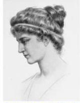
Αφιερωμένο στην Υπάτια (370-415)

14 ο Συνέδριο «Ελληνική Γλώσσα και Ορολογία»