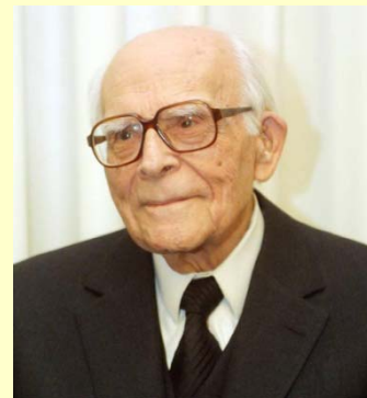
Αφιερωμένο στον Εμμανουήλ Κριαρά (1906 – 2014)